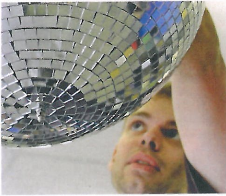
Ob Discokugel, oder LED-Wand in einer Spielstätte,...

Perfekt abgestimmte Musik könne, so Lienhart, bis zu 15 Prozent mehr Umsatz generieren.