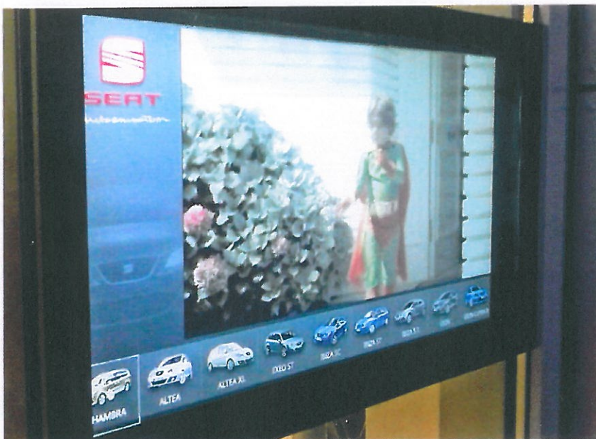
Vielseitiges Portfolio: Nutzerfreundliche Info-Systeme für Seat-Kunden.

Neben dem Hauptsitz in Kirrweiler, unterhält Raum plus Schall Kooperationen mit festen freien Mitarbeitern in München, Hamburg, Berlin und Köln, sodass sich das Einsatzgebiet von Raum plus Schall auf das gesamte Bundesgebiet erstreckt. Wie in den vergangenen vier Jahren, wird Raum plus Schall auch auf der kommenden IMA seine Einrichtungskompetenz präsentieren. □