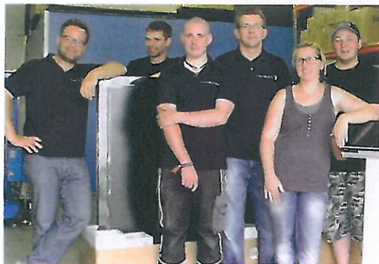
Engagiert: Das Raum plus Schall-Team. Zwei Mitarbeiter fehlen.